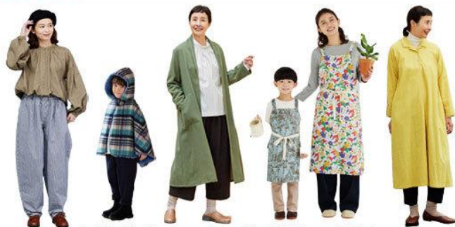
クラフト&ソーイングで楽しい毎日